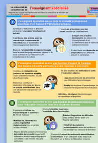
Voir le poster référentiel du PE spécialisé

Une des épreuves du CAPPEI (certificat d'aptitude professionnelle aux pratiques de l'éducation inclusive), concerne les actions de l'enseignant spécialisé "Personne Ressource" définies dans le référentiel du PE spécialisé.